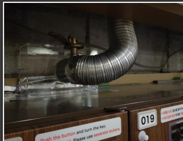
風量調整機取り付け