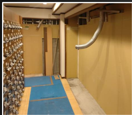
ダクトなどの工事