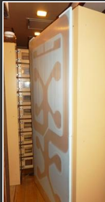
パネルダクト付き ロッカー設置