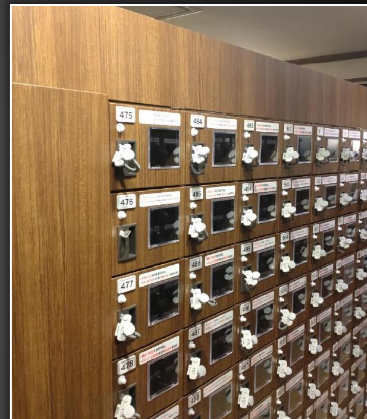
化粧カバー取り付け